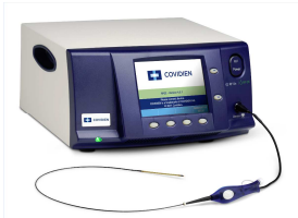
Technische Ausrüstung für das ClosureFast-Verfahren (VNUS)

Eine Alternative zum Stripping der Leitvenen bietet das moderne VNUS ClosureFast-Verfahren: Bei dieser Technik werden die Leitvenen nicht mehr gestrippt, sondern mittels Hochfrequenzenergie verschlossen. Unter Ultraschallkontrolle wird der Verschlusskatheter über einen kleinen Schnitt in die Vene eingeführt. Der mit Hochfrequenzenergie betriebene Katheter überträgt Wärme auf die Venenwand, welche infolge der Wärmeenergie schrumpft. Die Vene wird somit völlig verschlossen.